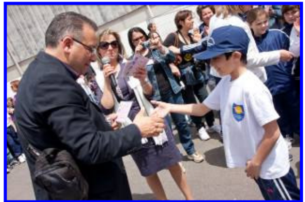
Foto di gruppo con PATENTE.