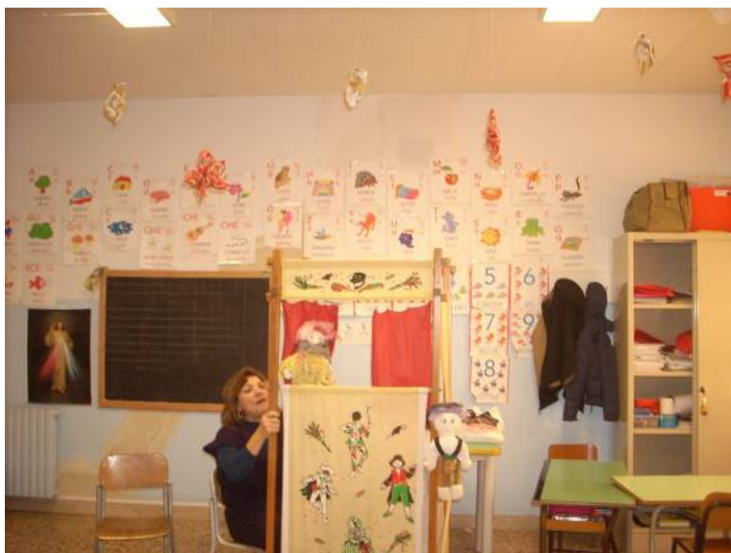
ECCO IL MOMENTO IN CUI LE INSEGNANTI CON L'AUSILIO DELLE MARIONETTE, RACCONTANO LA STORIA