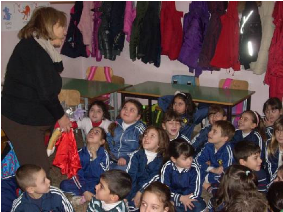
LE DOMANDE ALL'INSEGNANTE