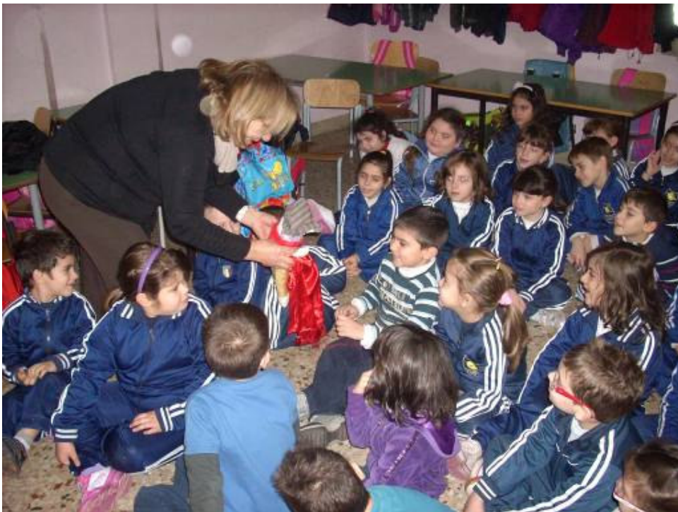
LA CURIOSITA' DEI BAMBINI.....