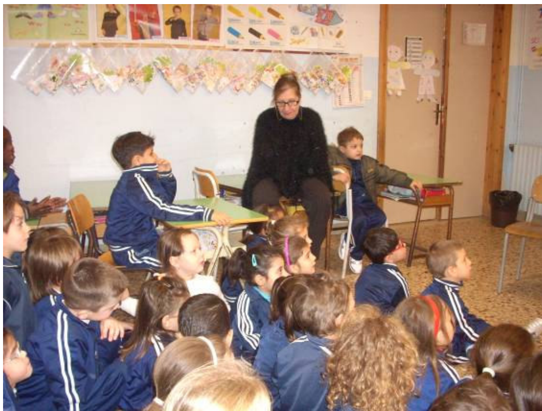
I BAMBINI AFFASCINATI DAL RACCONTO